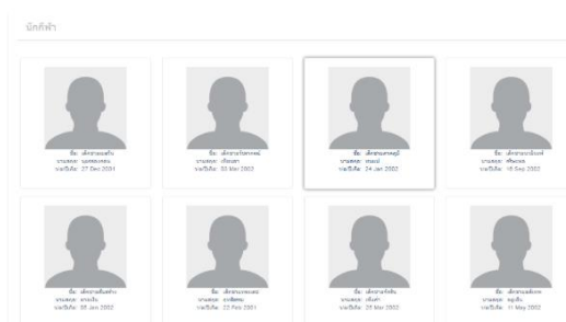
รูปที่ 8.2 นักกีฬา