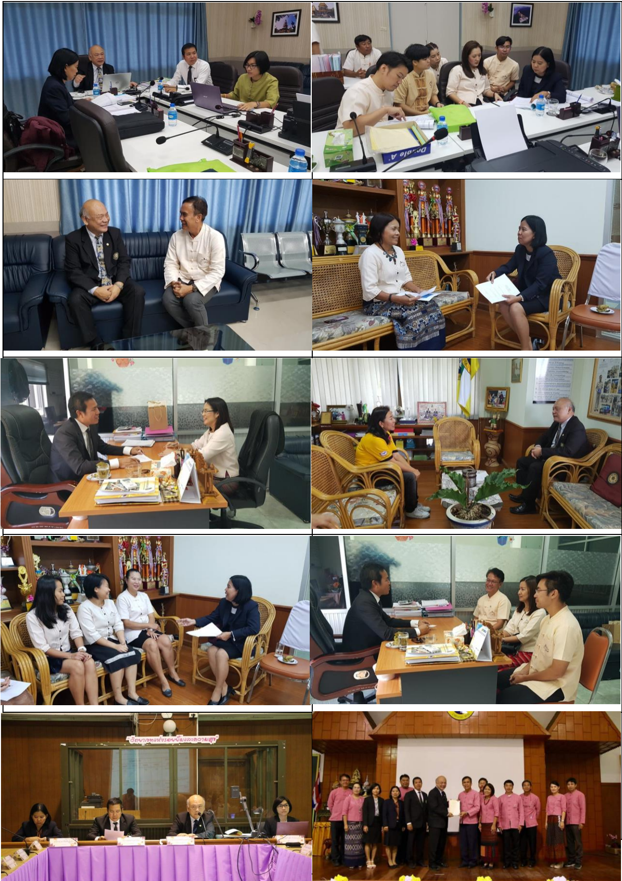
5.3 CMedu (CAR61)