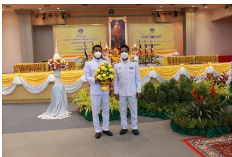
ภาพประกอบกิจกรรมวันคล้ายวันพระราชสมภพพระบาทสมเด็จพระนั่งเกล้าเจ้าอยู่หัว พระมหาเจษฎาราชเจ้า วันที่ ๓๑ มีนาคม ๒๕๖๕ ณ มหาวิทยาลัยราชภัฏยะลา อำเภอเมือง จังหวัดยะลา