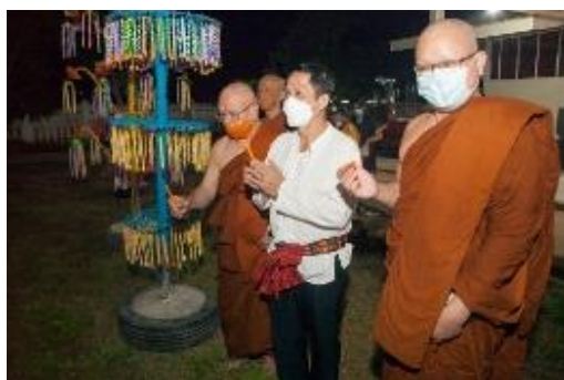
ภาพประกอบกิจกรรมงานบุญกระฐูป ออกพรรษา ช่อระกา ๒๕๖๔ วันที่ ๒๐ ตุลาคม ๒๕๖๔ ณ วัดดาวเรือง ตำบลช่อระกา อำเภอเมือง จังหวัดชัยภูมิ