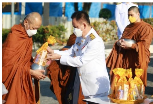
ภาพประกอบพิธีทำบุญตักบาตรถวายเป็นพระราชกุศลเนื่องในวันพ่อแห่งชาติ วันที่ ๓ ธันวาคม ๒๕๖๔ ณ อาคารสำนักงานอธิการบดี มหาวิทยาลัยการกีฬาแห่งชาติ จังหวัดชลบุรี