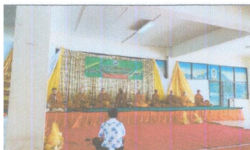
ภาพประกอบกิจกรรมเนื่องในวันคล้ายวันสถาปนามหาวิทยาลัยการกีฬาแห่งชาติ วิทยาเขตกระบี่ วันที่ ๒๑ กุมภาพันธ์ ๒๕๖๕ ณ มหาวิทยาลัยการกีฬาแห่งชาติ วิทยาเขตกระบี่ จังหวัดกระบี่