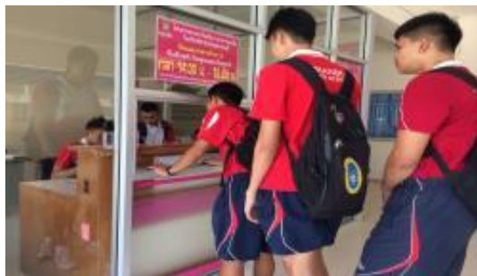
ภาพประกอบธนาคารโรงเรียน