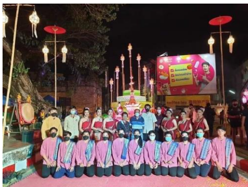
ภาพประกอบโครงการประเพณียี่เป็งเชียงใหม่ วันที่ ๑๙-๒๐ พฤศจิกายน ๒๕๖๔ ณ จังหวัดเชียงใหม่