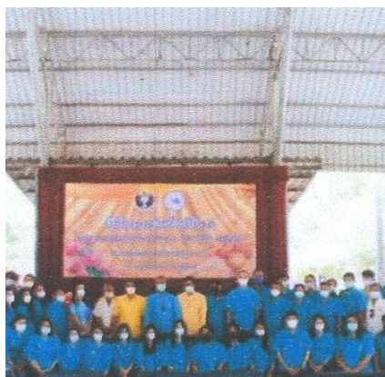
ภาพประกอบพิธีทำบุญวันขึ้นปีใหม่ และพิธีทอดผ้าป่าการศึกษา ปี ๒๕๖๕ วันที่ ๗ มกราคม ๒๕๖๕ ณ โรงเรียนกีฬาจังหวัดลำปาง จังหวัดลำปาง