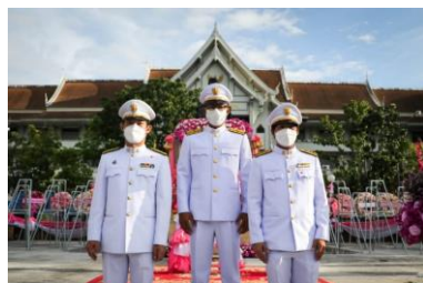
ภาพประกอบวางพวงมาลาเนื่องในวันปิยมหาราช วันที่ ๒๓ ตุลาคม ๒๕๖๔