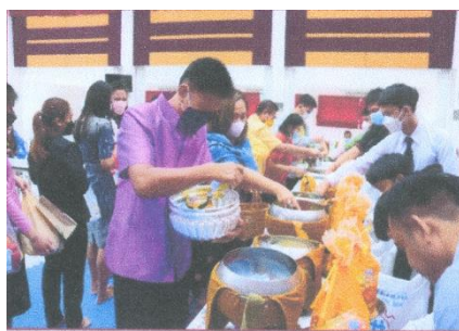
ภาพประกอบกิจกรรมวันคล้ายวันสถาปนามหาวิทยาลัยการกีฬาแห่งชาติ วิทยาเขตศรีสะเกษ ครบรอบ ๔๔ ปี วันที่ ๒๑ กุมภาพันธ์ ๒๕๖๕ ณ มหาวิทยาลัยการกีฬาแห่งชาติ วิทยาเขตศรีสะเกษ จังหวัดศรีสะเกษ