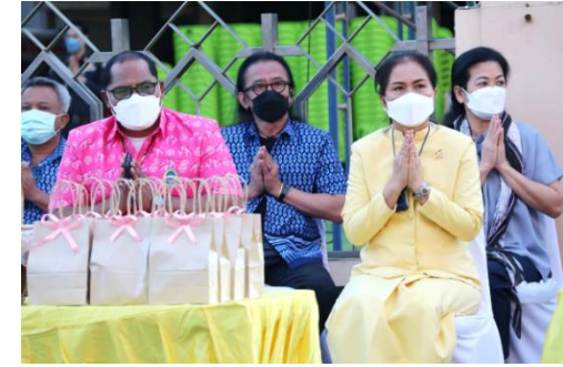
วันที่ ๘ มกราคม ๒๕๖๕ ณ สนามฟุตบอลโรงเรียนกีฬาจังหวัดสุพรรณบุรี จังหวัดสุพรรณบุรี