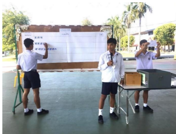
ภาพประกอบกิจกรรมการเลือกตั้งประธานสภานักเรียน รุ่นที่ ๒๗ วันที่ ๒๘ กุมภาพันธ์ ๒๕๖๕ ณ โรงเรียนกีฬาจังหวัดขอนแก่น จังหวัดขอนแก่น