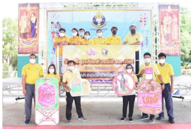
ภาพประกอบกิจกรรมรณรงค์งดดื่มสุรา ประจำปี ๒๕๖๔ วันที่ ๒๐ ตุลาคม ๒๕๖๔ ณ โรงเรียนกีฬาจังหวัดอ่างทอง จังหวัดอ่างทอง