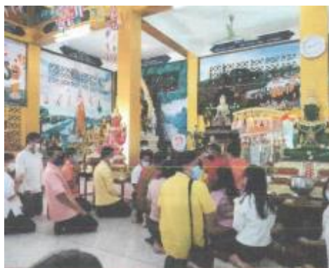
ภาพประกอบกิจกรรมทำบุญร่วมเป็นเจ้าภาพทอดกฐินสามัคคี วันที่ ๑๔ พฤศจิกายน ๒๕๖๔ ณ วัดหนองตะมะ อำเภอเมืองศรีสะเกษ จังหวัดศรีสะเกษ