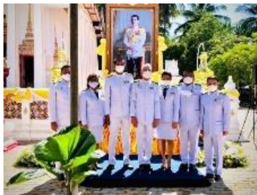
ภาพประกอบพิธีทอดกฐินพระราชทานกระทรวงการท่องเที่ยวและกีฬา วันที่ ๖ พฤศจิกายน ๒๕๖๔ ณ วัดชลธาราสิ่งเห วัดพิทักษ์แผ่นดินไทย จังหวัดนราธิวาส