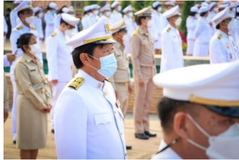
ภาพประกอบพิธีวางพานพุ่มดอกไม้ถวายราชสักการะสมเด็จพระนเรศวรมหาราช วันกองทัพไทย วันที่ ๑๘ มกราคม ๒๕๖๕ ณ จังหวัดลำปาง