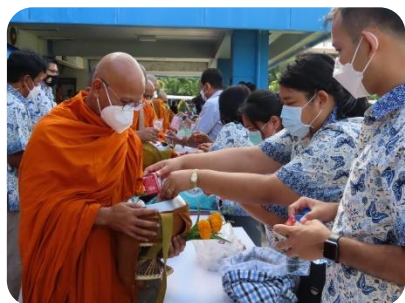
ภาพประกอบกิจกรรมทำบุญตักบาตรเนื่องในวันครบรอบวันสถาปนามหาวิทยาลัยการกีฬาแห่งชาติ วิทยาเขตยะลา วันที่ ๑๖ กุมภาพันธ์ ๒๕๖๕ ณ มหาวิทยาลัยการกีฬาแห่งชาติ วิทยาเขตยะลา จังหวัดยะลา