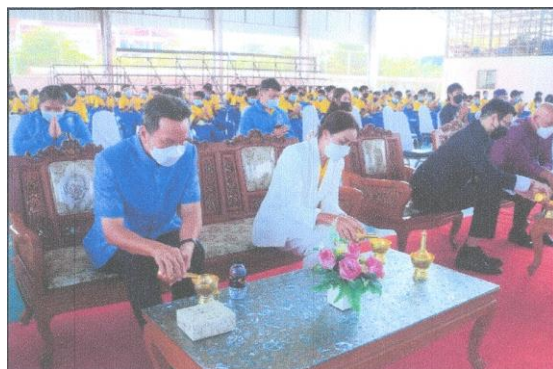
ภาพประกอบกิจกรรมวันคล้ายวันสถาปนาโรงเรียนกีฬาจังหวัดนครสวรรค์ วันที่ ๑๙ ธันวาคม ๒๕๖๔ ณ โรงเรียนกีฬาจังหวัดนครสวรรค์ จังหวัดนครสวรรค์