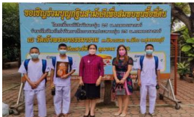
ภาพประกอบกิจกรรมธรรมะร้อยใจ สายใยผูกพัน ณ จังหวัดสุพรรณบุรี