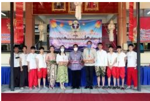
ภาพประกอบกิจกรรมล่องสะเปาจาวเวียงละกอน ประจำปี ๒๕๖๔ วันที่ ๑๙ พฤศจิกายน ๒๕๖๔ ณ จังหวัดลำปาง