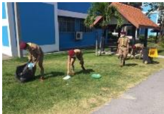
ภาพประกอบกิจกรรมจิตอาสาพัฒนาโรงเรียนและชุมชน วันที่ ๒๕ พฤศจิกายน ๒๕๖๔ ณ จังหวัดชลบุรี