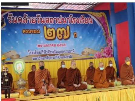
ภาพประกอบกิจกรรมวันคล้ายวันสถาปนาโรงเรียนกีฬาจังหวัดอุบลราชธานี ครบรอบ ๒๗ ปี วันที่ ๒๑ มกราคม ๒๕๖๕ ณ โรงเรียนกีฬาจังหวัดอุบลราชธานี จังหวัดอุบลราชธานี