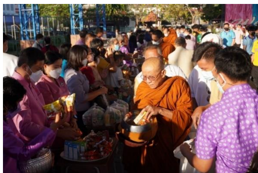
ภาพประกอบกิจกรรมทำบุญทอดผ้าป่าเพื่อการศึกษา วันที่ ๑๔ มกราคม ๒๕๖๕ ณ โรงเรียนสุนทรวัฒนา อำเภอเมือง จังหวัดชัยภูมิ