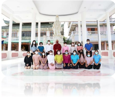
ภาพประกอบกิจกรรมสวดมนต์ฟังธรรมในวันธรรมสวนะ วันที่ ๒๕ มกราคม ๒๕๖๕ ณ วัดมหายานกาญจนมาศราชูฏร์บำรุง (วันญวน ยะลา) อำเภอเมือง จังหวัดยะลา