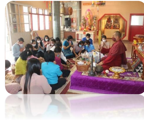
ภาพประกอบกิจกรรมสวดมนต์ฟังธรรมในวันธรรมสวนะ วันที่ ๑๐ มีนาคม ๒๕๖๕ ณ วัดตรีมิตร อำเภอเมือง จังหวัดยะลา