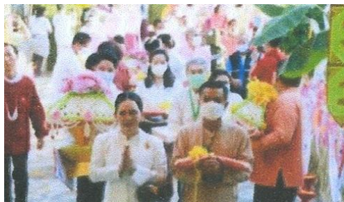
ภาพประกอบงานนั้งขบวนรถม้าทอดกฐินหนึ่งเดียวในโลก วันที่ ๑๘ พฤศจิกายน ๒๕๖๔ ณ วัดศรีรองเมือง อำเภอเมืองลำปาง จังหวัดลำปาง