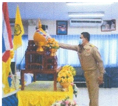
ภาพประกอบกิจกรรมพิธีถวายสัตย์ปฏิญาณเพื่อเป็นข้าราชการที่ดีและพลังของแผ่นดิน วันที่ ๑ ตุลาคม ๒๕๖๔ ณ ห้องประชุมชั้น ๔ โรงเรียนกีฬาจังหวัดลำปาง จังหวัดลำปาง