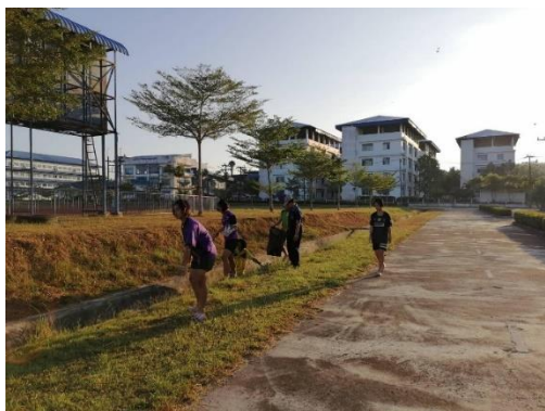
ภาพประกอบโครงการ Big Cleaning Day วันที่ ๑ พฤศจิกายน ๒๕๖๔ ณ โรงเรียนกีฬาจังหวัดตรัง จังหวัดตรัง