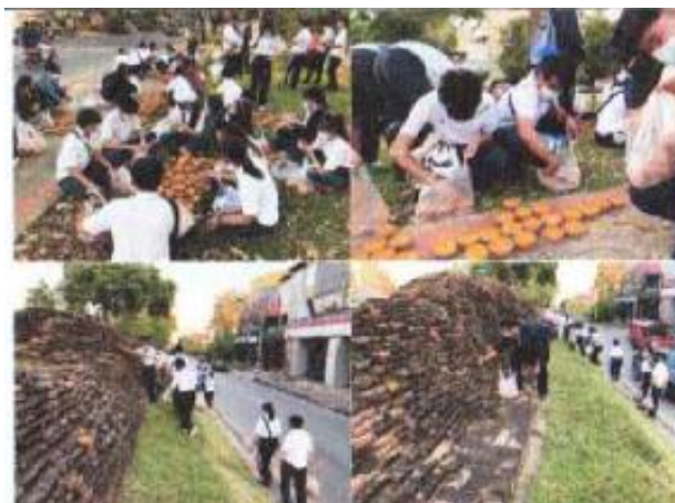
ภาพประกอบกิจกรรมตามผางปะติ๊ดส่งฟ้ามาฮักษาเมือง ปีที่ ๑๐/๒๕๖๔ วันที่ ๑๗ พฤศจิกายน ๒๕๖๔ ณ แจ่งหัวลินดำนใน อำเภอเมือง จังหวัดเชียงใหม่