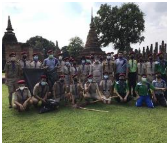
ภาพประกอบกิจกรรมจิตอาสาเก็บขยะและขยะหลังงานประเพณีลอยกระทงจังหวัดสุโขทัย วันที่ ๒๒ พฤศจิกายน ๒๕๖๔ ณ จังหวัดสุโขทัย