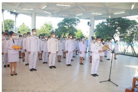
ภาพประกอบพิธีถวายพานพุ่มดอกไม้และถวายบังคมเนื่องในวันพ่อแห่งชาติ วันที่ ๓ ธันวาคม ๒๕๖๔ ณ อาคารสำนักงานอธิการบดี มหาวิทยาลัยการกีฬาแห่งชาติ จังหวัดชลบุรี