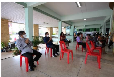
ภาพประกอบพิธีทำบุญเนื่องในโอกาสส่งท้ายปีเก่าต้อนรับปีใหม่ ๒๕๖๕ วันที่ ๒๙ ธันวาคม ๒๕๖๔ ณ ห้องเกียรติยศ อาคารพญาแล มหาวิทยาลัยการกีฬาแห่งชาติ วิทยาเขตชัยภูมิ จังหวัดชัยภูมิ