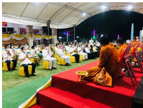
ภาพประกอบพิธีเจริญพระพุทธมนต์สมโภชองค์พระกฐินพระราชทานจากพระบาทสมเด็จพระวชิรเกล้าเจ้าอยู่หัวฯ ประจำปี ๒๕๖๔ วันที่ ๑๕ พฤศจิกายน ๒๕๖๔ ณ มหาวิทยาลัยราชภัฏชัยภูมิ จังหวัดชัยภูมิ