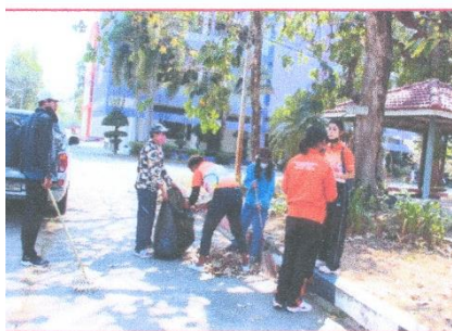
ภาพประกอบกิจกรรมจิตอาสาพัฒนามหาวิทยาลัย วันที่ ๒๑ กุมภาพันธ์ ๒๕๖๕ ณ มหาวิทยาลัยการกีฬาแห่งชาติ วิทยาเขตศรีสะเกษ จังหวัดศรีสะเกษ