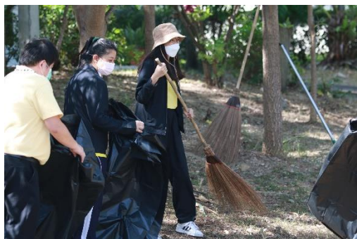
ภาพประกอบกิจกรรมจิตอาสา “เราทำความดี ด้วยหัวใจ” วันที่ ๓ ธันวาคม ๒๕๖๔ ณ บริเวณมหาวิทยาลัยการกีฬาแห่งชาติ จังหวัดชลบุรี