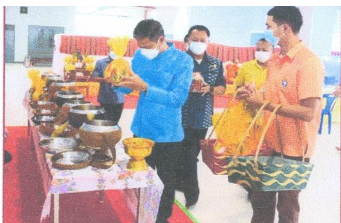
ภาพประกอบโครงการสานสัมพันธ์วันปีใหม่ ๒๕๖๕ วันที่ ๑๔ มกราคม ๒๕๖๕ ณ มหาวิทยาลัยการกีฬาแห่งชาติ วิทยาเขตศรีสะเกษ จังหวัดศรีสะเกษ