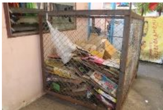
ภาพประกอบโครงการธนาคารขยะ