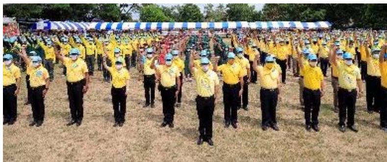
ภาพประกอบกิจกรรมจิตอาสาพัฒนาโรงเรียนและชุมชน วันที่ ๑๓ ตุลาคม ๒๕๖๔ ณ จังหวัดขอนแก่น