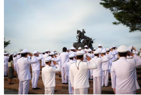
วันที่ ๑๘ มกราคม ๒๕๖๕ ณ พระบรมราชานุสาวรีย์สมเด็จพระนเรศวรมหาราช อำเภอตอนเจดีย์ จังหวัดสุพรรณบุรี