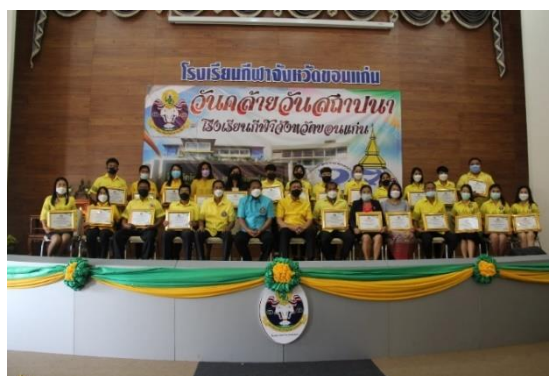
ภาพประกอบกิจกรรมคัดเลือกบุคลากรเพื่อยกย่องคนดีมีคุณธรรม และเป็นแบบอย่างการประพฤติปฏิบัติ วันที่ ๒๗ มกราคม ๒๕๖๕ ณ ห้องประชุมเสียงแคนดอกคูน โรงเรียนกีฬาจังหวัดขอนแก่น จังหวัดขอนแก่น