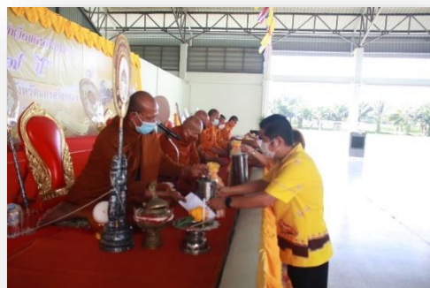
ภาพประกอบกิจกรรมวันคล้ายวันสถาปนาโรงเรียนกีฬาจังหวัดนครศรีธรรมราช วันที่ ๒๑ มกราคม ๒๕๖๕ ณ โรงเรียนกีฬาจังหวัดนครศรีธรรมราช จังหวัดนครศรีธรรมราช