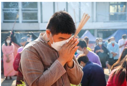
ภาพประกอบกิจกรรมวันคล้ายวันสถาปนามหาวิทยาลัยการกีฬาแห่งชาติ วิทยาเขตลำปาง ครบรอบ ๔๒ ปี ณ มหาวิทยาลัยการกีฬาแห่งชาติ วิทยาเขตลำปาง จังหวัดลำปาง