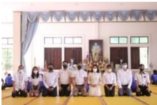
ภาพประกอบกิจกรรมทำบุญตักบาตร เนื่องในวันออกพรรษา วันที่ ๒๑ ตุลาคม ๒๕๖๔