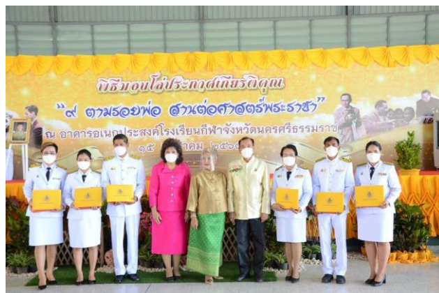
ภาพประกอบโครงการ ๙ ตามรอยพ่อ สานต่อศาสตร์พระราชา วันที่ ๑๕ มกราคม ๒๕๖๕ ณ โรงเรียนกีฬาจังหวัดนครศรีธรรมราช จังหวัดนครศรีธรรมราช