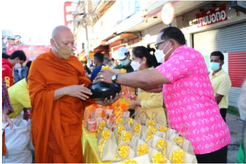
ภาพประกอบกิจกรรมทำบุญตักบาตรข้าวสารอาหารแห้งเนื่องในวันปีใหม่ ๒๕๖๕ วันที่ ๑ มกราคม ๒๕๖๕ ณ สำนักงานเทศบาลเมืองสุพรรณบุรี จังหวัดสุพรรณบุรี