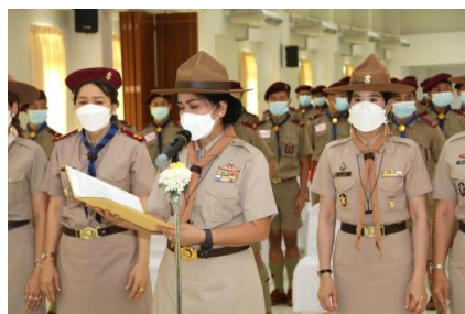
ภาพประกอบโครงการลูกเสือจิตอาสาพระราชทานในสถานศึกษา