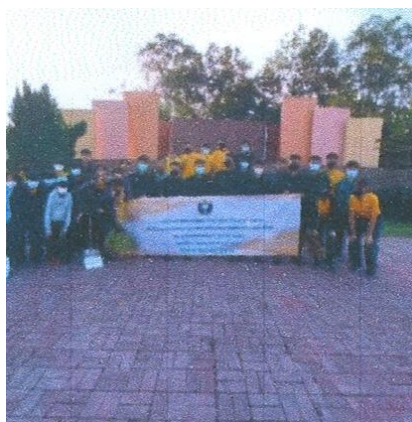
ภาพประกอบกิจกรรมจิตอาสา เนื่องในวันพ่อแห่งชาติ วันที่ ๕ ธันวาคม ๒๕๖๔ ณ จังหวัดลำปาง