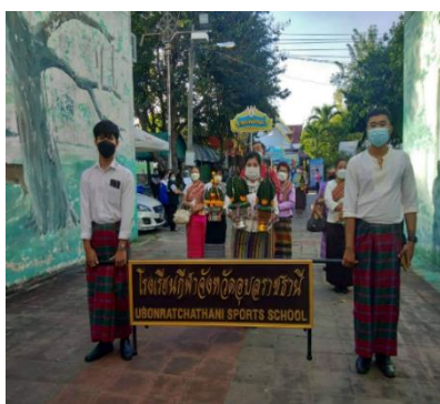
ภาพประกอบกิจกรรมบวงสรวงและสวดดีวีรกรรมกรมพระปทุมวราชสุริยวงศ์ (เจ้าคำผง) ประจำปี ๒๕๖๔ และวันรำลึกแห่งความดีชาวอุบลราชธานี วันที่ ๑๑ พฤศจิกายน ๒๕๖๔ ณ อนุสาวรีย์แห่งความดีชาวอุบลราชธานี บริเวณทุ่งศรีเมือง จังหวัดอุบลราชธานี