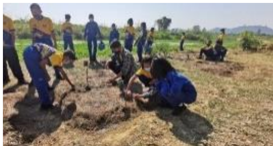
ภาพประกอบกิจกรรมเศรษฐกิจพอเพียง