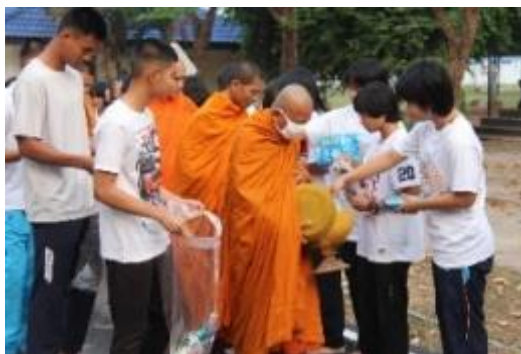
ภาพประกอบกิจกรรมทำบุญตักบาตรประจำเดือน ณ จังหวัดขอนแก่น