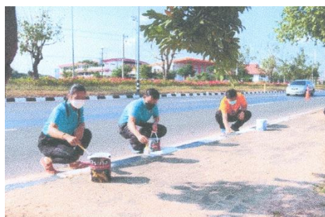
ภาพประกอบกิจกรรมจิตอาสาพัฒนาปรับปรุงภูมิทัศน์และพัฒนาเมือง วันที่ ๙ กุมภาพันธ์ ๒๕๖๕ ณ ถนนหน้ามหาวิทยาลัยการกีฬาแห่งชาติ วิทยาเขตศรีสะเกษ จังหวัดศรีสะเกษ