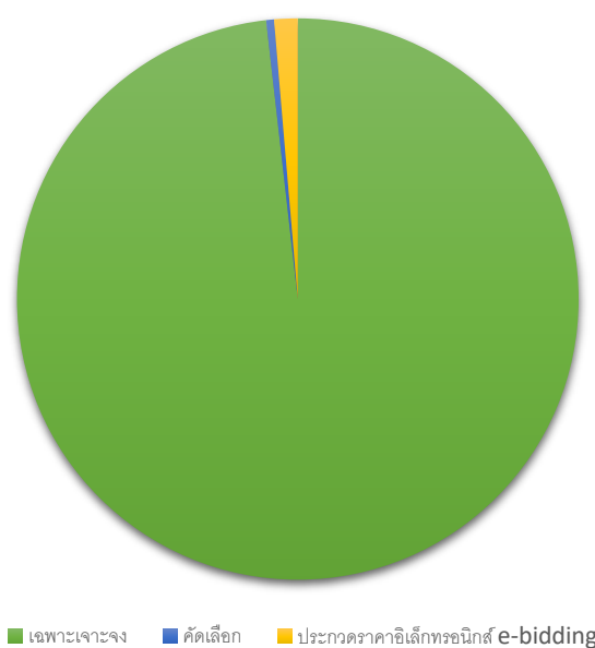
กราฟแสดงจำนวนโครงการที่จัดซื้อจัดจ้าง ในปีงบประมาณ พ.ศ. 2563